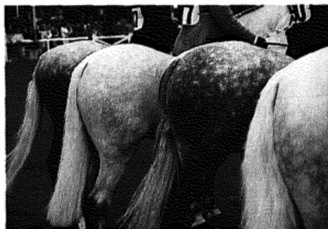
Zur Dublin Horse Show kommen Experten aus der ganzen Welt, um Pferde zu kaufen und verkaufen Seite 46