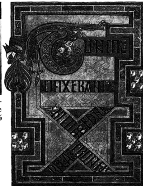
Wer schuf dieses Buch? Seite 70