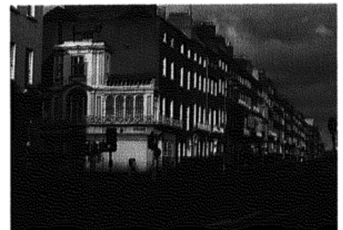
Die Häuser aus georgianischer Zeit gehören zum Schönsten in der Hauptstadt Dublin Seite 36