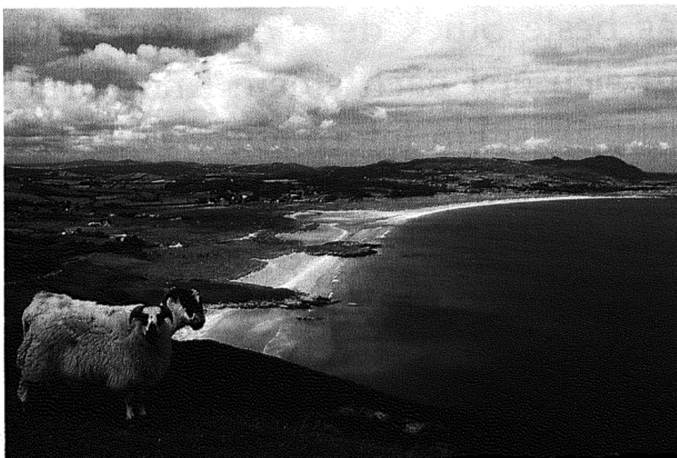
Das Donegal bietet Ruhe für die Seele und Genuß für die Augen Seite 90