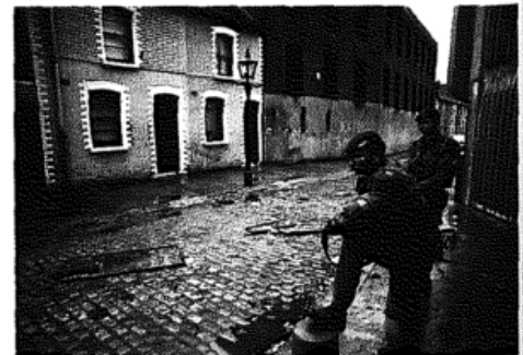
In Belfast beherrscht das Militär das Stadtbild. Die Politiker haben bisher keinen Frieden gebracht Seite 58