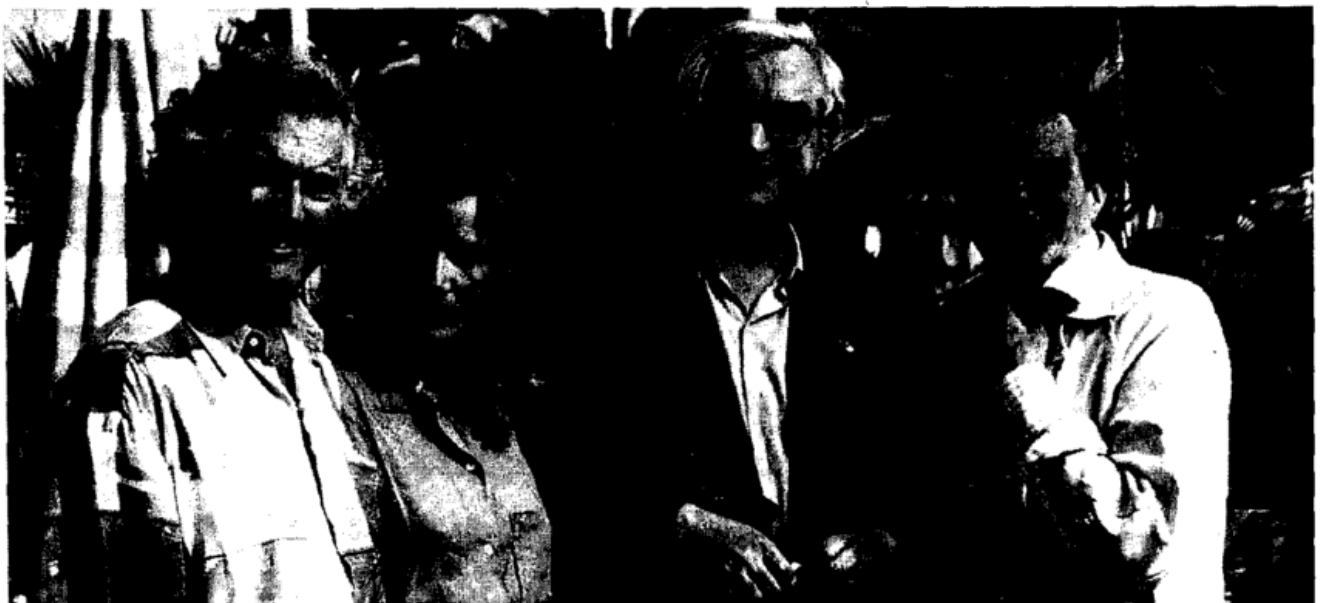
Festival de Cannes 90 : Fernando Solanas, Dominique Sanda, Bertrand Tavernier, Dirk Bogarde