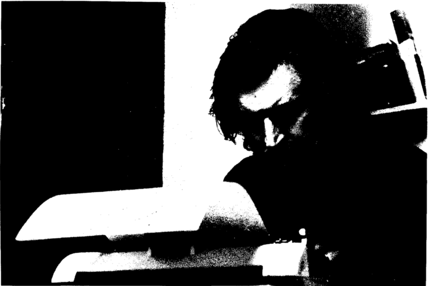
Fernando Solanas ou la rage de transformer le monde, 1978