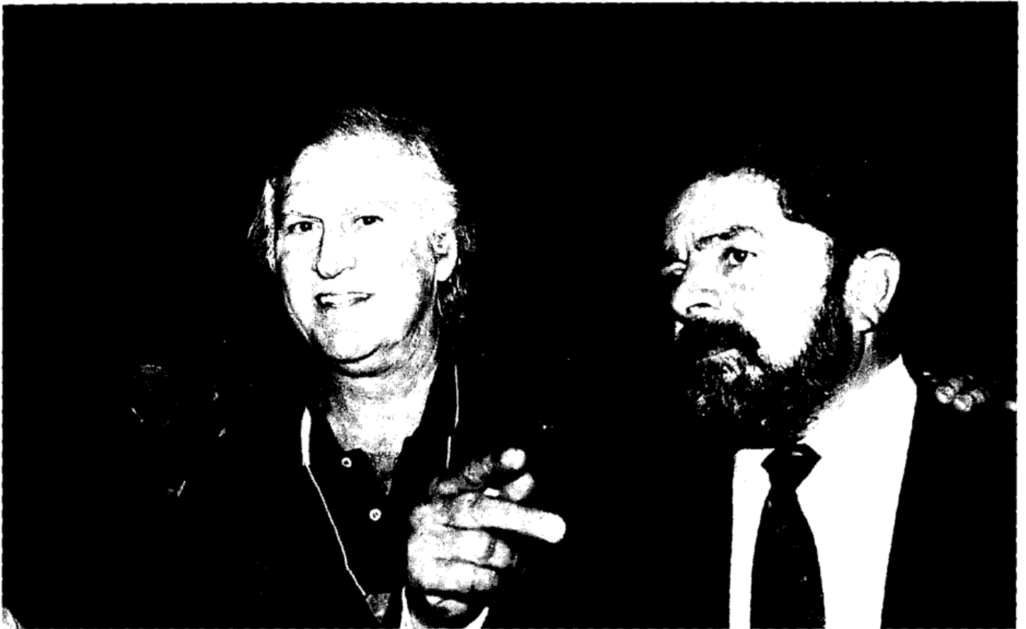
Fernando Solanas aux rencontres nationales du PT (Parti des Travailleurs), Brasilia, 29 avril au 1 er mai 1994