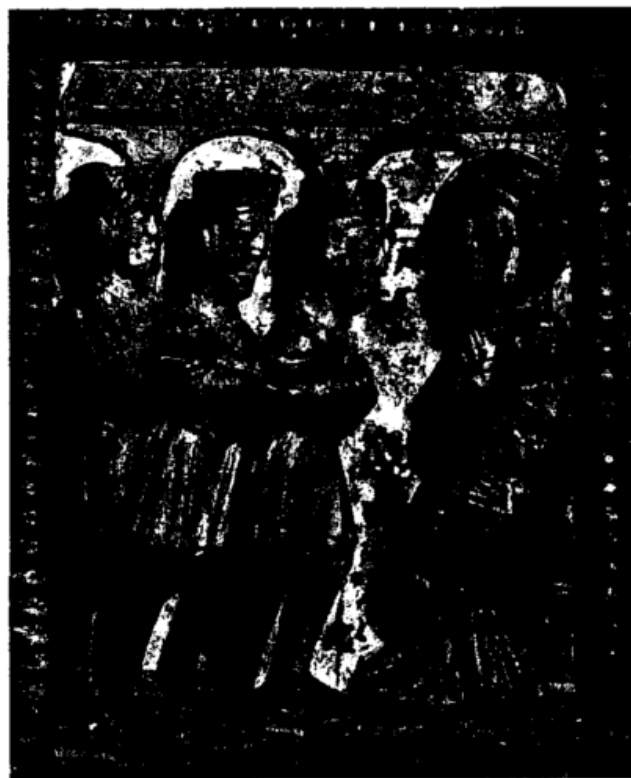
Bild 2: Anbetung der drei Könige, Holztür der Kirche Maria im Kapitol, Köln, 11. Jh.