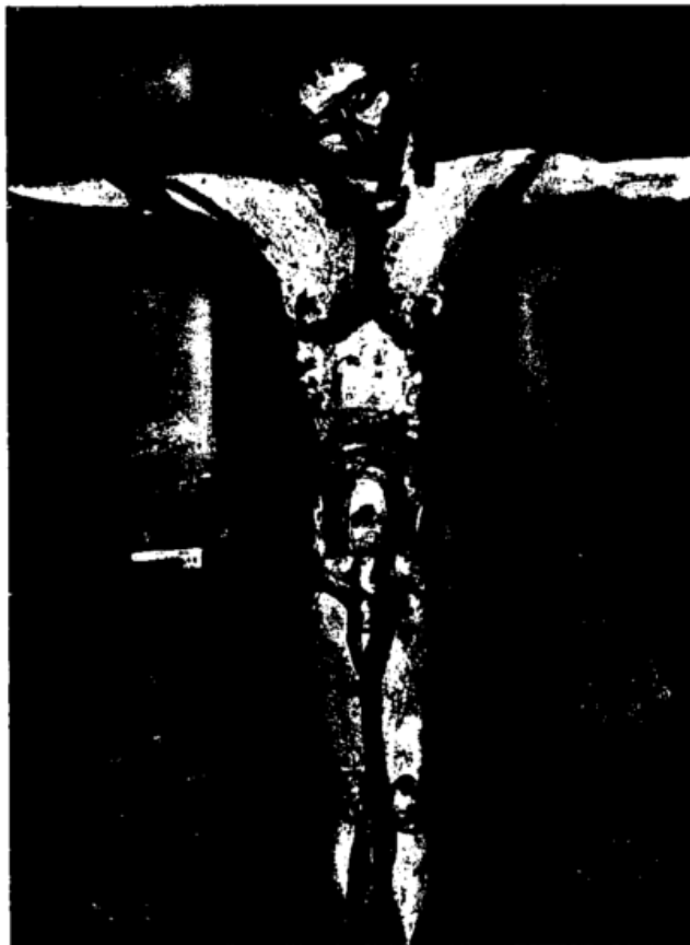
Bild 3: Georges Rouault, Unter einem Jesus am Kreuz, hier vergessen. Blatt 20 aus dem Zyklus Miserere, 1917–27. (Doppelsinnige Anspielung auf das französische Ge- setz von 1905, wonach aus allen Gerichtssälen die Kruzifixe entfernt werden mußten.)